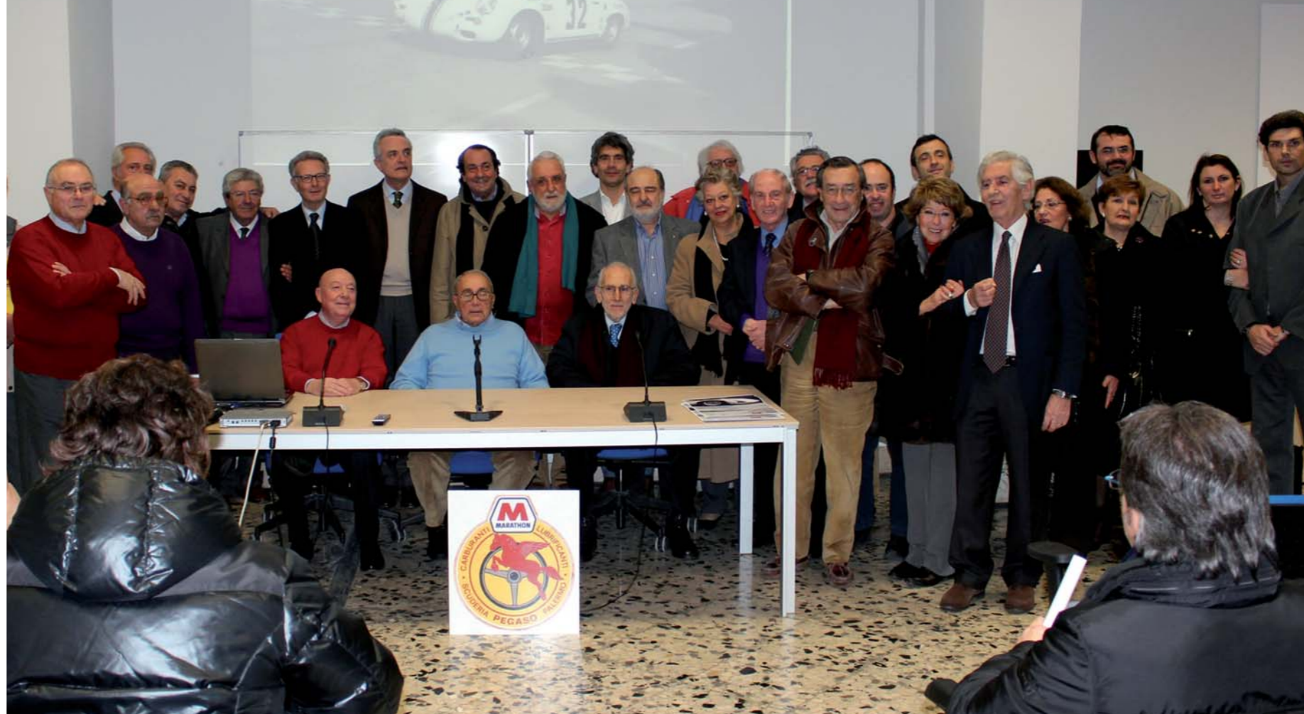
Sopra: i piloti della Scuderia Pegaso ed i familiari di quelli scomparsi, oggi. Sotto: uno dei locali del Museo che si trova nell'edificio 8 della Facoltà di Ingegneria

Commozione certo; perchè ritrovarsi per la prima volta tutti insieme - tantissimi anni dopo una frequentazione assidua - e dovendo fare i conti pure con qualche dolorosa assenza, provoca almeno un groppo alla gola. Se non qualcosa in più... Ma anche "passione". L'altro elemento caratterizzante di una serata, e di una mostra, che hanno fatto rivivere i "Favolosi anni della Scuderia Pegaso alla Targa Florio". Ben organizzata dal Museo Storico dei Motori e dei Meccanici- ➤