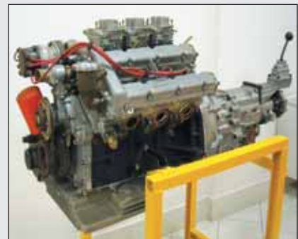
Motore Fiat tipo 101 per vettura Fiat 501. 1919-1926; Motore e trasmissione Lancia per vettura Flaminia berlina 2500. 1957-1961; Motore Fiat tipo 135C per Fiat Dino 2400, Dino 246 (Ferrari), Lancia Stratos. 1969-1976

Motore monocilindrico Benelli 500 cc per motocicletta Benelli 500 VLM. Anni '40; Motore Fiat tipo 104 per vettura Fiat 8V. 1952-1954