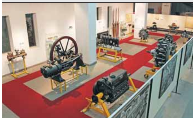
Il Museo ha sede presso il Dipartimento di Ingegneria Chimica Gestionale, Informatica Meccanica www.museomotori.unipa.it